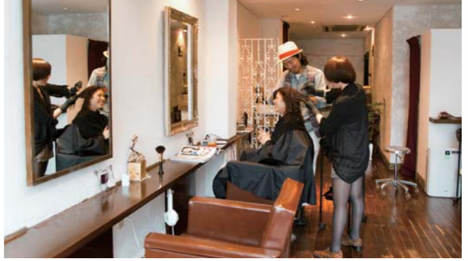
▲一人一人の雰囲気大切に、似合うを提案してくれます♪