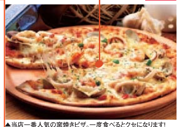
▲当店一番人気の窯焼きピザ。一度食べるとクセになります!

本場イタリア仕込みの味をお手軽に味わっていただけるイタリアンレストランです。当店自慢の生パスタと石窯で焼き上げたピザをご賞味ください。